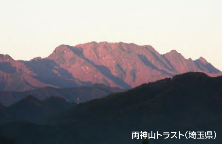
両神山トラスト(埼玉県)

土地を買い取ることで開発を未然に防ぎ、美しい風景や豊かな自然を後世に引き継ぐナショナル・トラスト活動に取り組んでいます。 当会は、各地のトラスト団体と連携しながら、自らも全国56か所の森や湿原などを取得して守っています。