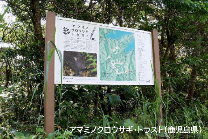
アマミノクロウサギ・トラスト(鹿児島県)