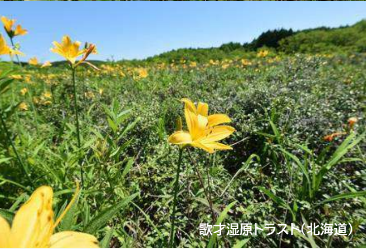
歌才湿原トラスト(北海道)