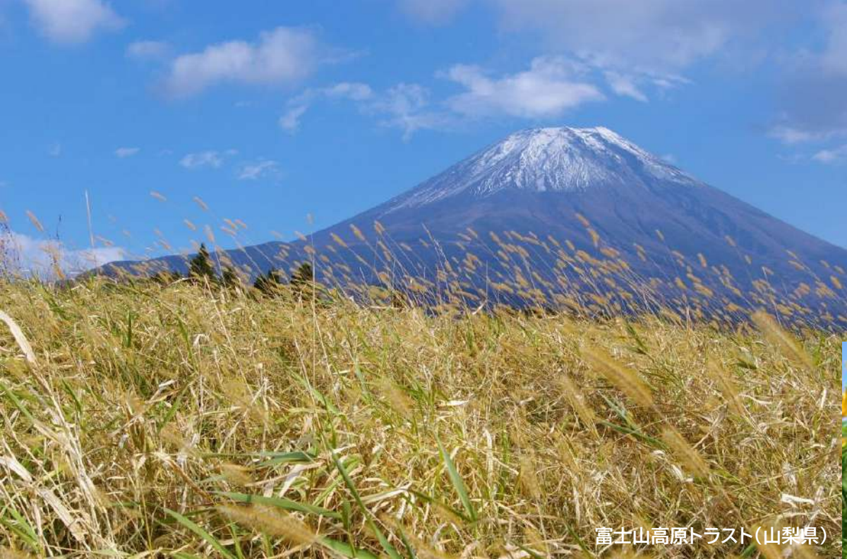
富士山高原トラスト(山梨県)